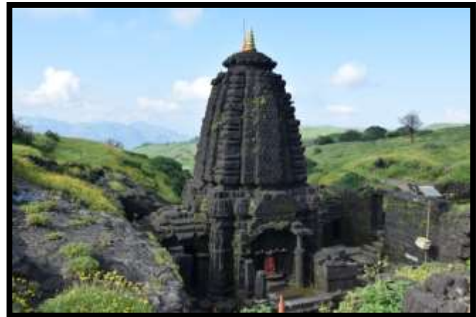
हरिशचंद्र देवेश्वर मंदिर